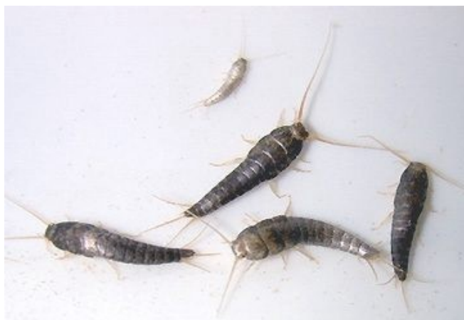
Pececillo de plata